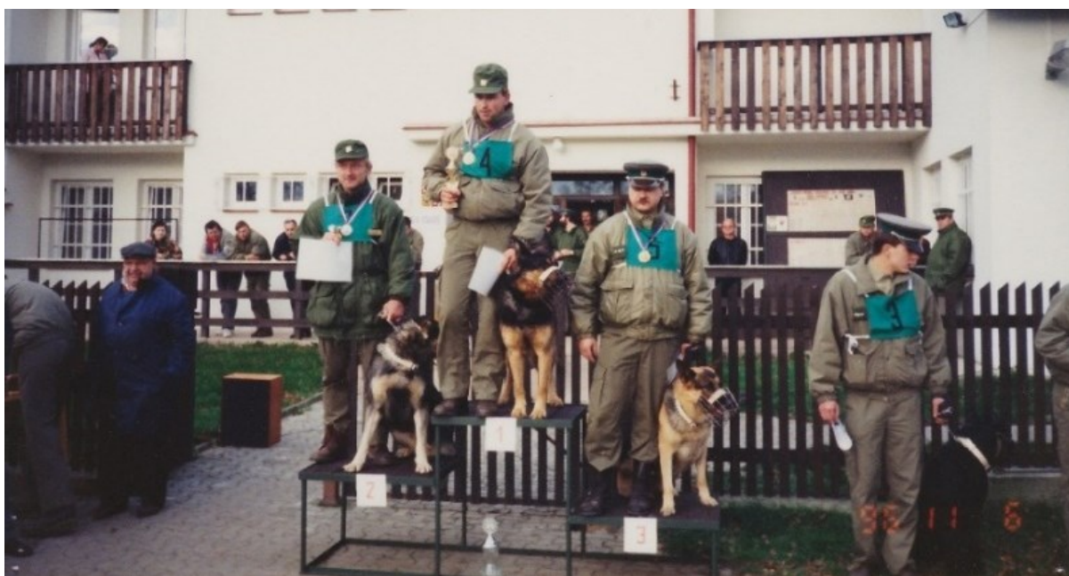
Z dávnověku kynologických šampionátů...

Generální ředitelství cel je prostřednictvím výcvikového střediska v Heřmanicích pravidelným pořadatelem otevřeného mistrovství psovodů služebních psů ve vyhledávání drog, tabáku a kategorie psů obranných s mezinárodní účastí. I. ročník tohoto mistrovství organizačně zajišťoval Oblastní celní úřad Děčín v roce 1996 na Mezní Louce. Od roku 1997 se pak všechny další šampionáty pořádaly vždy již v režii VZSK Heřmanice, a to postupem doby jako otevřené s účastí všech bezpečnostních sborů ČR, tj. Celní správy, Policie ČR, Cizinecké policie, Armády ČR, Vojenské policie a Vězeňské služby ČR, a také s účastí zahraničních družstev celních správ a zahraničních rozhodčích (Rakouska, Německa, Nizozemí, USA a Austrálie). Mezi pravidelné účastníky patřily např. Norsko, Rakousko, Slovensko, USA, Polsko, Lotyšsko, Rusko, Moldávie a další státy. Řada zemí na naše šampionáty vysílala pozorovatele, např. Rusko, Izrael, Litva, Bulharsko, aby následně začaly podle českého vzoru (a mnohdy i českých propozic) pořádat svá národní mistrovství.