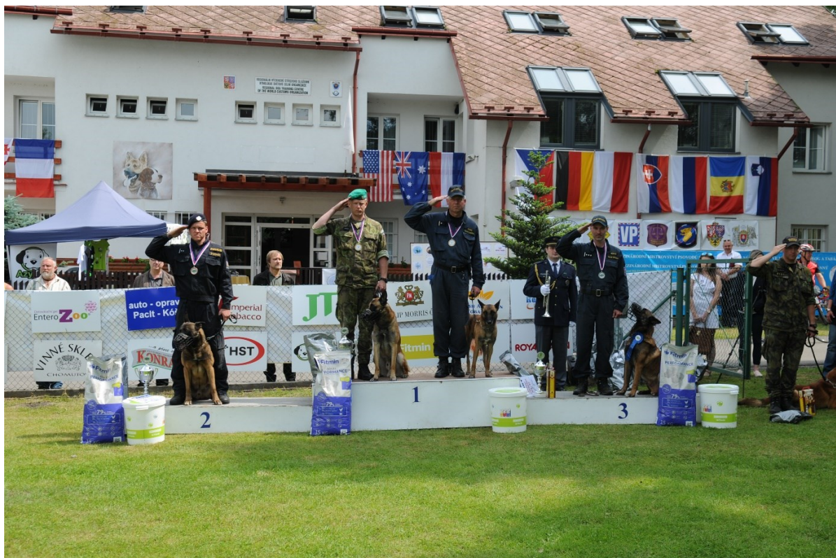
Ze závěrečného slavnostního ceremoniálu 17., 8. a 8. mezinárodního mistrovství psovodů služebních psů Celní správy ČR ve vyhledávání drog, tabáku a v kategorii psů obranných v červnu 2016

Národní kynologické šampionáty Celní správy ČR mají vedle vysoké soutěžní úrovně vždy vysokou společenskou úroveň. Bývají pravidelně zahajovány v prostorách obřadní síně městské radnice ve Frýdlantě, a to vždy pod záštitou generálního ředitele Generálního ředitelství cel, starosty města Frýdlantu a v posledních letech i pod záštitou hejtmána Libereckého kraje a ministra financí. Závěr šampionátů pak často probíhá s bohatým prezentačním a protidrogovým programem, určeným zejména pro školy a veřejnost, na náměstí T. G. Masaryka ve Frýdlantě. Účastní se ho tuzemští i zahraniční hosté, zástupci Parlamentu a Senátu ČR, krajských a městských samospráv i bezpečnostních sborů ČR.