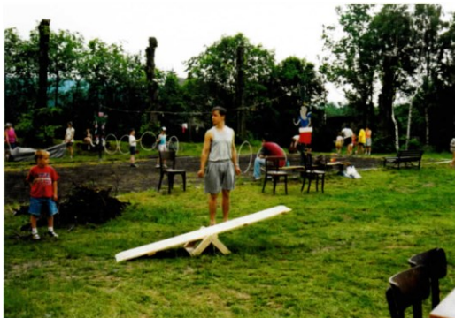
Dětský den 29. 5. 1999

Narazili jsme na mnoho překážek, zažili spoustu úspěšných okamžiků, vnímali jsme názory a hodně moudrostí. Myšlenku má i to, že tělesná cvičení mohou nahradit mnoho léků, ale žádný lék na světě nemůže nahradit daná tělesná cvičení. Cvičili jsme.