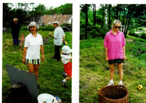
Dětský den 27. 5. 2000