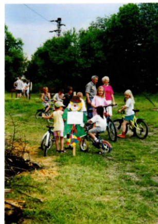
Dětský den 29. 5. 1999