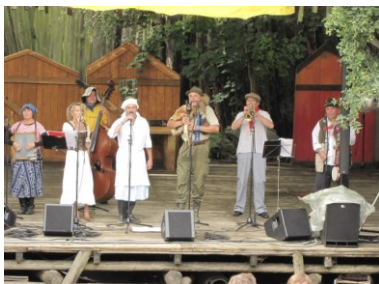
Kulturinsel Einsiedel v Německu 2012