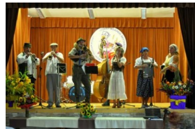
Folklorní festival v Polsku 2012