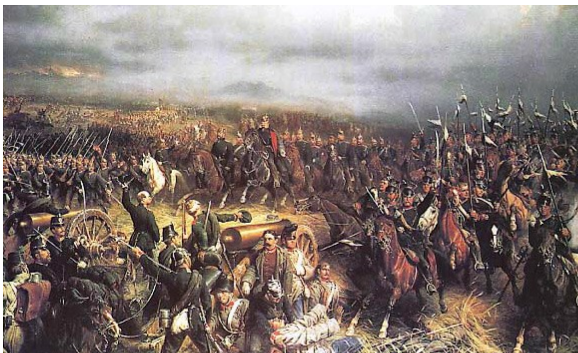
Bitva u Hradce Králové 3. července 1866

Přeskočíme nyní několik století, v nichž se sice událo mnoho významného, a snad se k tomu postupně ještě vrátíme. I naši oblast postihly události třicetileté války (1618-1648), stejně jako následující úsilí rodu Habsburků o ovládnutí Evropy, o což se na přelomu 18. a 19. století pokoušel i korsický rod Bonapartů. A konečně výše uvedená válka prusko-rakouská v roce 1866. V řadách poraženého rakouského vojska bojovali také muži z Heřmanic a okolí. Domů se však někteří z nich již nevrátili a odpočívají kdesi v cizině. Nejsou však zapomenuti. Letos je tomu 140 let, co jim byl postaven v Kristiánově pomník. O tom ale zase příště.