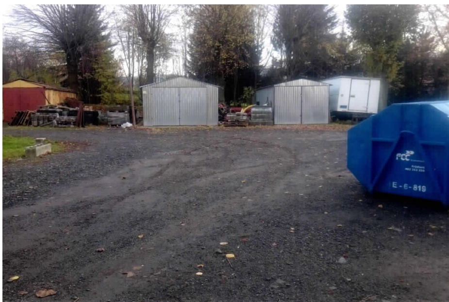
1985: vybudování volejbalového hřiště 1986-2010: využívané 2010 – současnost: viz fotografie