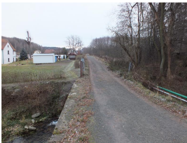
Zbytky náhonu u rodiny Nejedlů