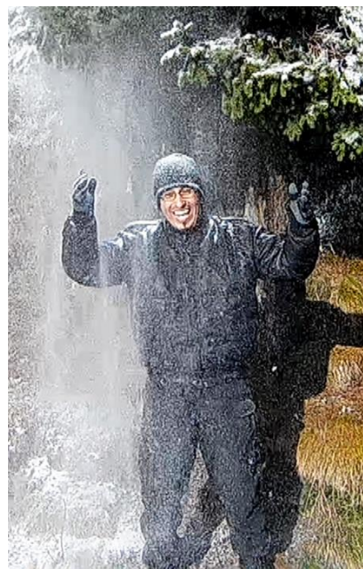
Radost ze sněhu byla obrovská!