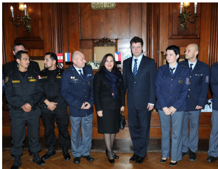
8. 12. 2016: Slavnostní předávání mezinárodních certifikátů psodům CS Peru na frýdlantské radnici za přítomnosti velvyslankyně Peru v ČR