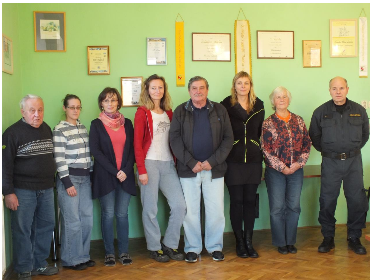
Redakční rada Heřmanického občasníku.