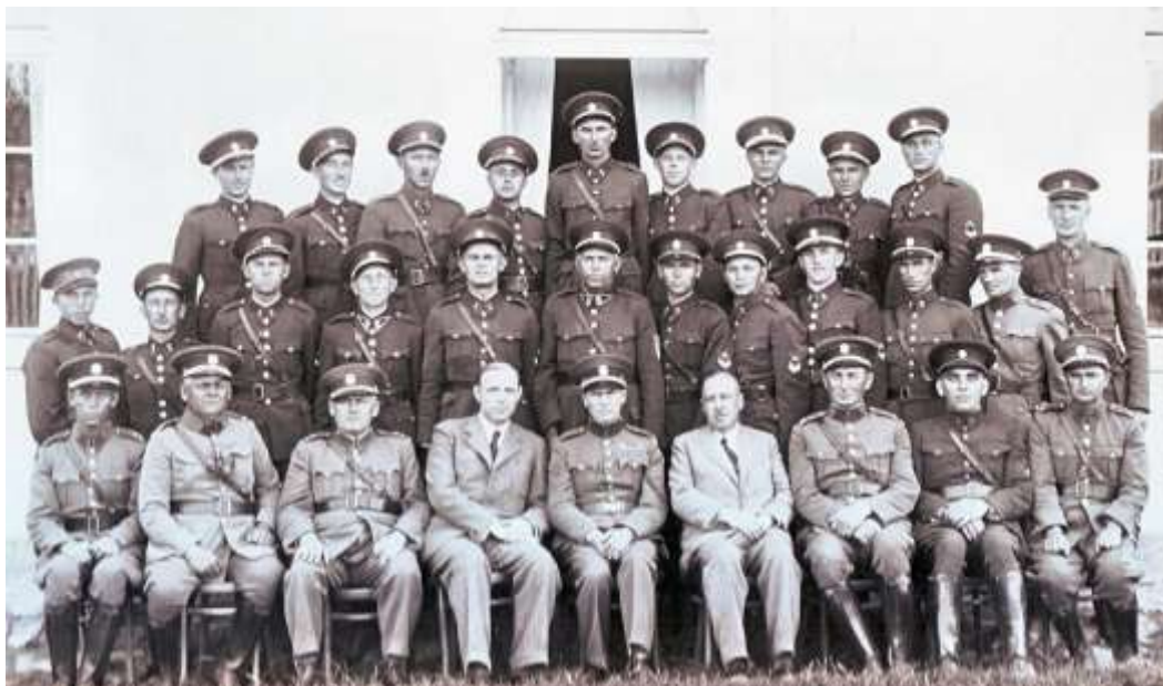
Členové Finanční stráže, účastníci IV. kurzu v Pyšelích, 1937

Dne 1. 8. 1952 vzniká Ústřední celní správa ČSR, tím se vytvořila nová organizace celnictví. V době zřízení měla 82 celnic, rozmístěných po celé republice. S novou organizací byl také vydán celní zákon č. 36, který byl platný až do roku 1974. Podoba organizace vydržela do současné doby, byť s některými změnami, a to zejména po vstupu České republiky do Evropské unie.