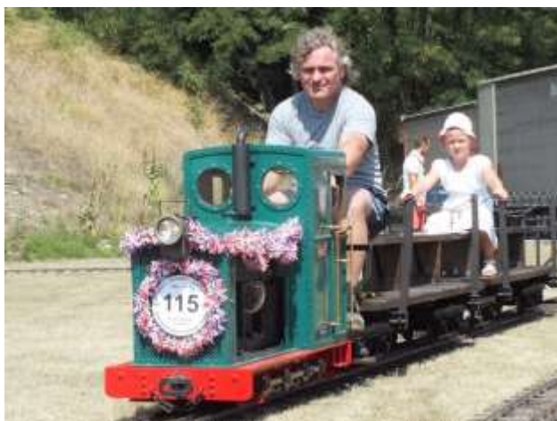
Mašinka svezla nejen mnoho dětí, ale i dospělých