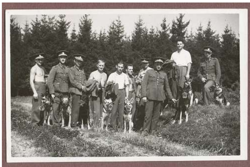
Kurz Finanční stráže v Pyšelicích, kolem roku 1937

Po dlouholeté stagnaci, vycházející v podstatě ještě z c. k. byrokratických předpisů a nařízení, a po přímém odmítání služebních psů se zdálo, že jim i jejich vůdcům vychází šťastná hvězda. V prosinci 1936 dokonce ministerstvo financí uvolnilo prostředky pro výstavbu vlastního ústavu pro výcvik psů Finanční stráže. Byl zakoupen pozemek v Pyšelicích a v dubnu 1937 byla firmě Ing. arch. L. Třísky zadána stavba samostatného výcvikového střediska. Vzhledem k politické situaci se však tento projekt nikdy neuskutečnil. Snad i tato slova přispěla k vydání výnosu ministerstva financí ze dne 28. března 1935 o zavedení služebních psů u Finanční stráže, a to i s připojenou instrukcí. Podmínky zde uváděné byly přijatelné téměř pro každého a probudily zájem o chov a výcvik psů i mezi nejmladšími příslušníky Finanční stráže.