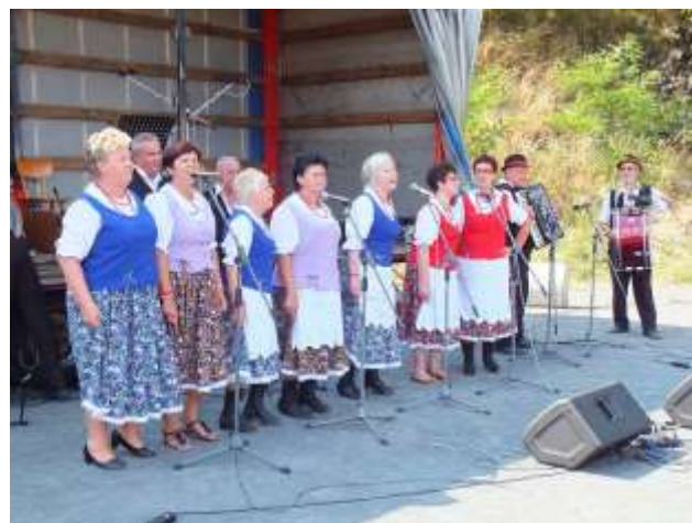
Pěvecký sbor Lasowianie z polského Piensku