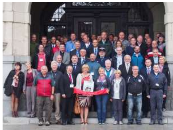
Společné foto účastníků konference před frýdlantskou radnicí