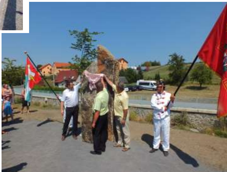
Slavnostní odhalení památníku povodni 7. 8. 2010 a její oběti