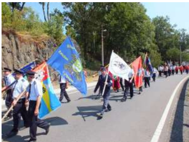
Průvodu obcí se zúčastnilo mnoho občanů, v čele šli zástupci sborů záchranných složek